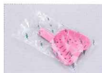
衛生的な個別包装