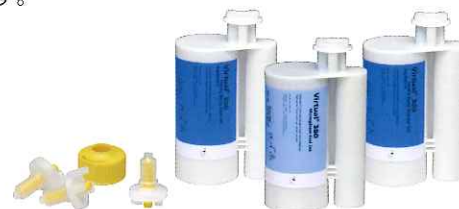
バーチャル XL (キャンペーン対象外です。)

新登場のバーチャル XLは、押し出すのに力が必要なトレー材の盛り付けが自動練和器で行えるので、スムーズに印象採得ができます。モノフェーズ(ファースト)とヘビーボディ(レギュラー/ファースト)をご用意しています。