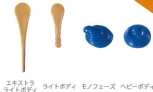
エキストラ ライトボディ モノフェーズ ヘビーボディ ライトボディ