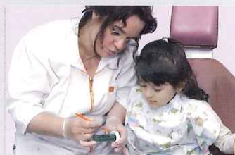
ブラークでも培養でき、ガムが噛めない 子供にも使用できます。