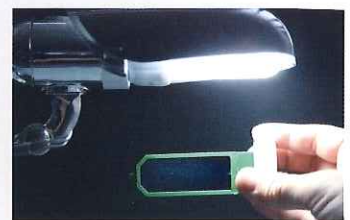
光源下でははっきり見えるので、 簡単に撮影して残せます。