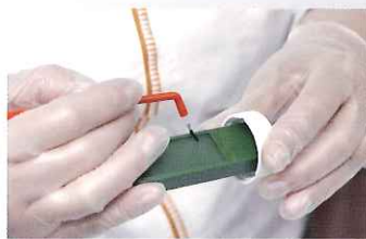
SM菌もLB菌も、 48時間で1度に培養できます。