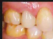
色調メタルコアオベークによる接着