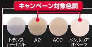
審美的な修復を実現する4色