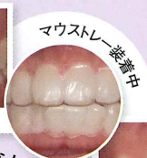
マウスピース装着中