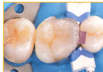
ボンディング処理後CR充填