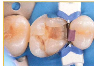
II級マトリックスシステムを使用した隔壁