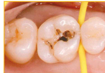
プレウェッジを行いながらう蝕歯質を除去し、窩洞形成