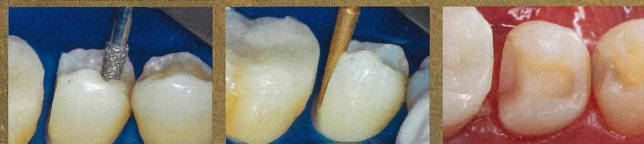
RS1(レギュラー)咬合面部の形成