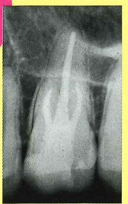
※JIS T6006 (2018) 準拠 (サンメディカル社試験による)