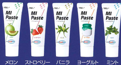
メロン ストロベリー バニラ ヨーグルト ミント