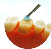
シーリング・コーティング

「BioコートCa」及び「ハイブリッドコートII」は、歯質表面を薄く硬い被膜でコーティングし、形成後の外來刺激や二次う蝕から歯質を守ります。 シーリング・コーティング以外にも知覚過敏抑制材、ボンディング材としてもご利用いただける、マルチユース材料です。