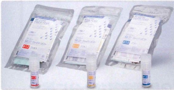
種類 ● φ1.2、φ1.4、φ1.6 (mm) 希望医院価格 ● 1袋 = ¥12,540 1本あたりの価格627円