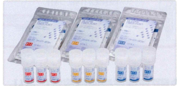
種類 ● φ1.2、φ1.4、φ1.6 (mm) 希望医院価格 ● 1袋 = ¥35,800 1本あたりの価格596円