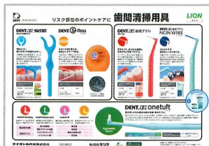
リスク部位のポイントケア啓発チラシ(表面)