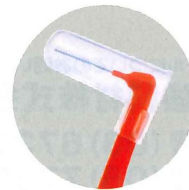
携帯用キャップ付