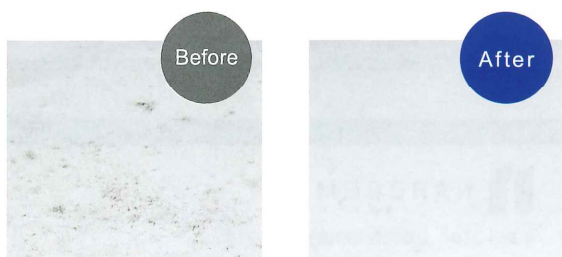
黒カビを除去、抗菌効果もあります