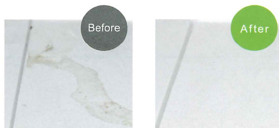
黄ばみ、油汚れにもお使いいただけます